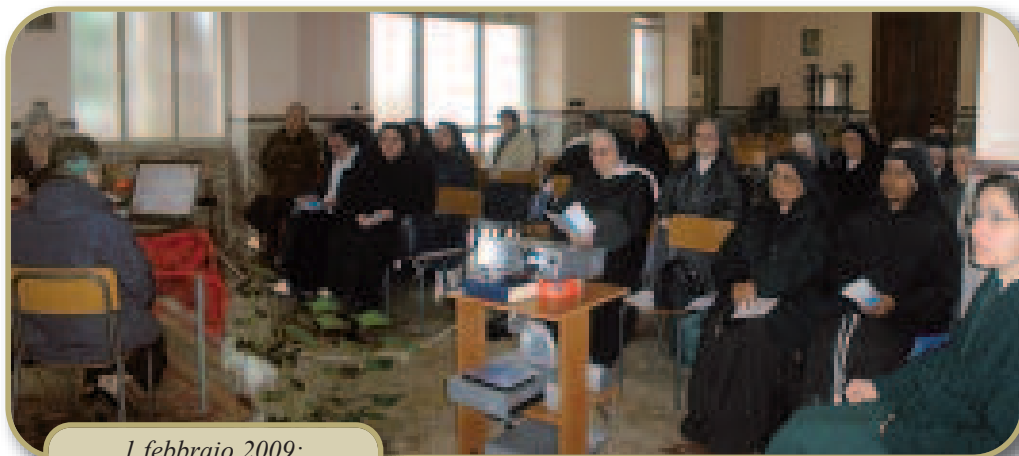
1 febbraio 2009: Giornata Diocesana della Vita Consacrata.

All'inizio della Quaresima è giunta, poi, in Santuario una copia della S. Croce che il Papa Giovanni Paolo II ha voluto fosse realizzata per le