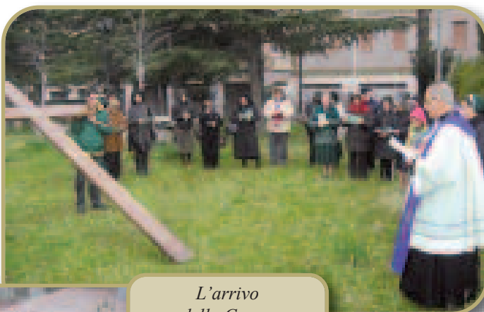
L'arrivo della Croce.

La permanenza della Croce in Santuario è stata un'occasione per offrire a tutti i membri della Comunità Parrocchiale la possibilità della Riconciliazione sacramentale e per radunare in preghiera i giovani, attorno al segno